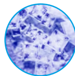
バイオミネラル (ミネラル塩)

STERIORA®は研磨剤を使用せずにスーパーフードの持つ天然の抗菌成分とバイオミネラル(ミネラル塩)が、口内環境を悪化させるバイオフィームを除去します。